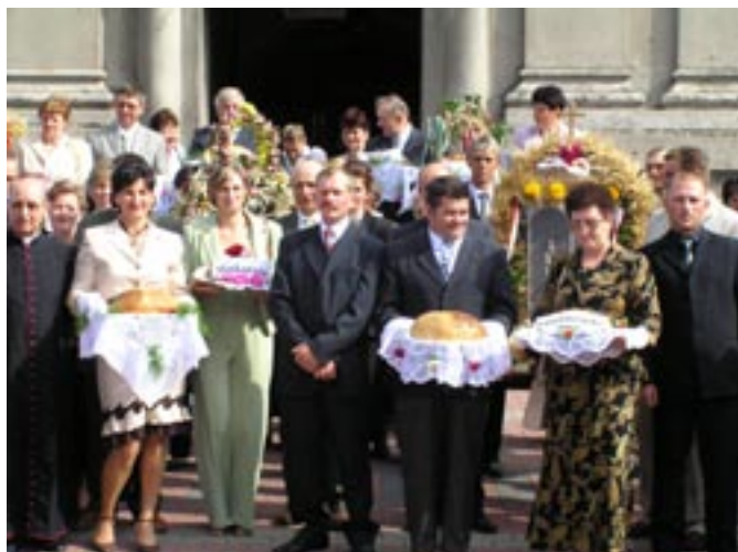
Starostowie Dożynek i delegacje z wieńcami przed kościołem.

Dożynki rozpoczęły się mszą św. o godz. 14.00 w kościele parafialnym w Koźminku, którą odprawił ksiądz proboszcz z Rajska Grzegorz Kamzol. Po mszy korowód z chlebami i wieńcami przeszedł na boisko sportowe w Koźminku.