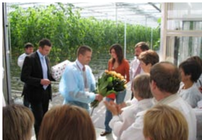
Dni otwarte w Gospodarstwie Państwa Dziubków.