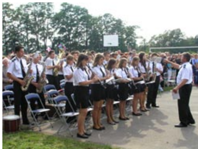
Gminna Orkiestra podczas wykonywania „Roty”.