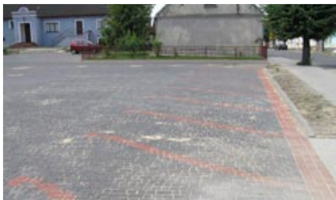
Nowy parking za kościołem.

Parking w Koźminku ul. Mielęckiego (2006) - 175 000,00 zł z czego udział Parafii Koźminek - 65 000 ,00 zł.