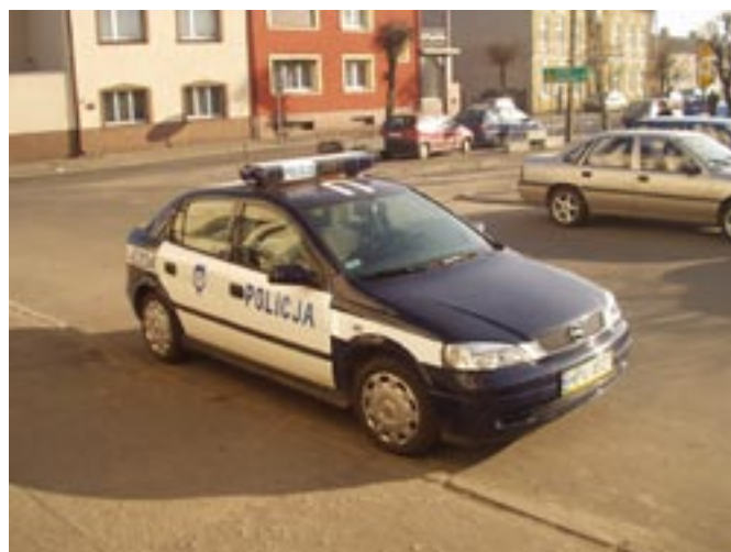
Nowy radiowóz dla Policji.

Zakup samochodu dla posterunku Policji w Koźminku (2003) - 25 000 zł.