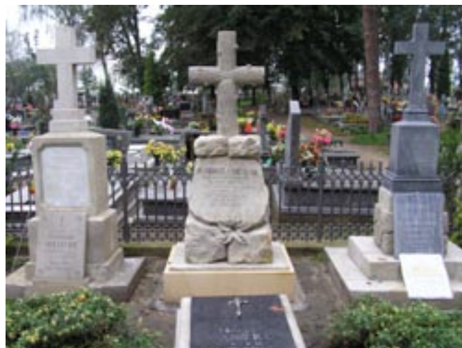
Odnowiony grobowiec Wielkiego Patrioty.

Renowacja grobowca dr Andrzeja Mielęckiego (2006) - 12 000,00 zł.