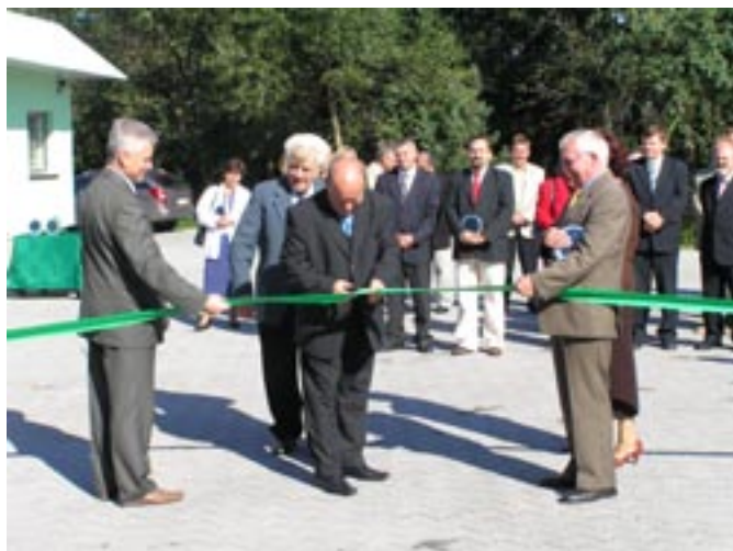
Uroczyste przecięcie wstęgi na zmodernizowanej Oczyszczalni Ścieków.

W dniu 6 października 2006 oddano do użytku zmodernizowaną i unowocześnioną oczyszczalnię ścieków w Koźminku. Istniejąca oczyszczalnia ścieków została wybudowana w latach 1994-1997 kosztem około 970 tys. zł. Projektem i wykonaniem inwestycji zajęła się Firma „Ekologia” z Kalisza.