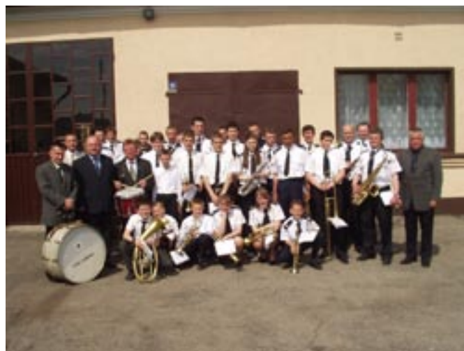
Gminna Orkiestra Dęta.