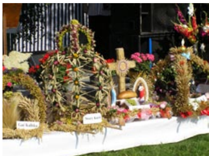
Tradycyjne wieńce na dożynkach.