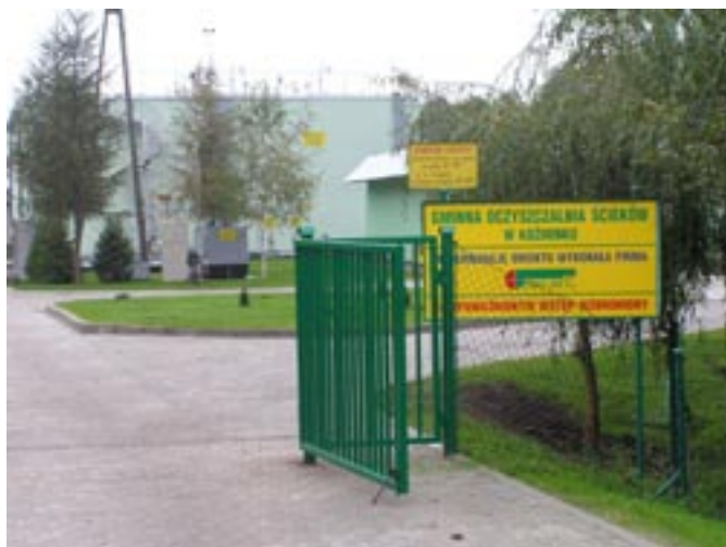
Zmodernizowana Oczyszczalnia Ścieków w Koźminku.

Modernizacja to konieczność zwiększenia jej wydajności, a szczególnie podniesienie parametrów oczyszczanych ścieków w związku z istniejącym zbiornikiem Murowaniec.