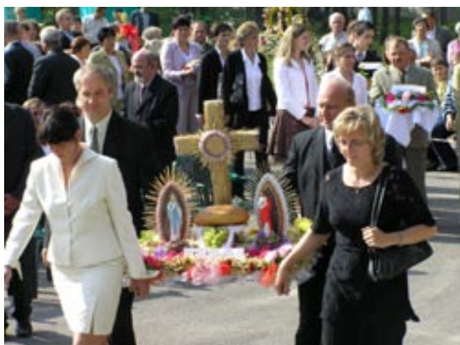
Delegacja sołectwa Dąbrowa.