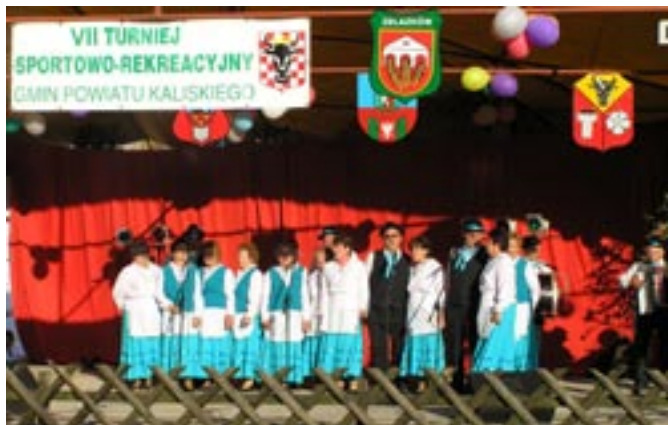
Zespół ludowy „Koźminianki”.

gminne i kościelne uroczystości. Występuje również podczas różnych imprez powiatowych.