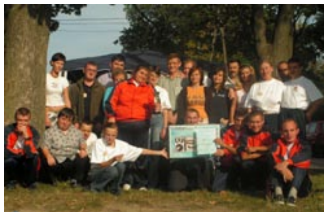
Zespół WTZ Koźminek.

W nagrodę z rąk Starosty Kaliskiego drużyna otrzymała puchar, wieżę stereo i dyplom. Jest to czwarty puchar zdobyty przez nasze warsztat. Serdecznie gratulujemy wspaniałego sukcesu.