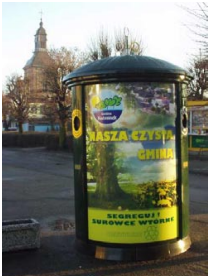
Pojemnik do segregacji odpadów.

Zakup pojemników do segregacji odpadów (2003-2004) - 46 097,62 zł z czego dotacja stanowiła kwotę -19 000,00 zł