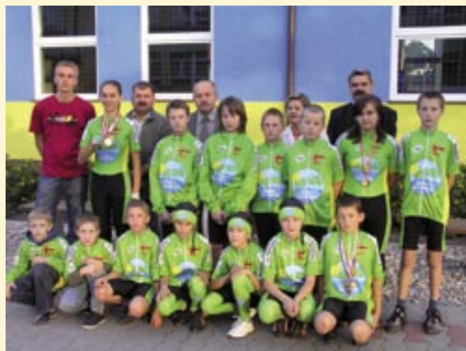
Zawodnicy UKS Koźminianka w nowych strojach.

Autor: Prezes UKS Koźminianka M. Chenczke