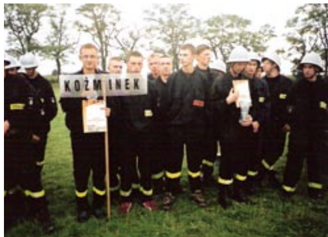
Powiatowe Zawody OSP.

W kategorii męskiej najlepszą drużyną okazała się OSP Tykadłów, II miejsce zajęła OSP Aleksandria, a III miejsce zajęła OSP Rychnów. W zawodach wzięła udział drużyna z OSP Koźminek (męska), która zajęła 6 miejsce.