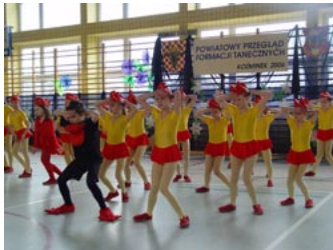
Zespół „Słoneczka” ze Szkoły Podstawowej w Koźminku.

W szkołach gminnych odnotowano szereg znaczących sukcesów uczniów. Ich ilość jest tak duża, że wymaga odrębnego opracowania. W Szkole Podstawowej Koźminek poza kolarstwem sukcesy odnotowały kółka taneczne prowadzone przez Panią Małgorzatę Nawrocką. Dokonania „Słoneczka 1” „Słoneczka 2” i „Dance Club” sięgają daleko ponad szczebel Gminy.