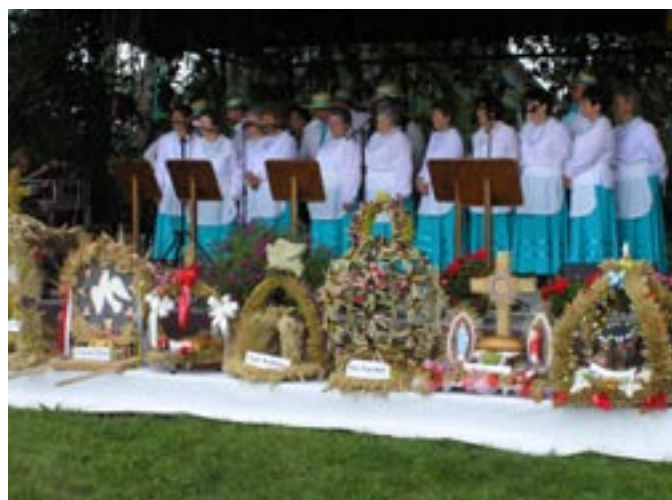
Zespół ludowy Koźminianki podczas występu na Dożynkach.

wysiłek włożony w pracę przy zbiorach zbóż oraz przedstawił główne kierunki działania gminy. Po obrzędzie zaproszono wszystkich obecnych do spożywania tradycyjnego, swojskiego jadła.