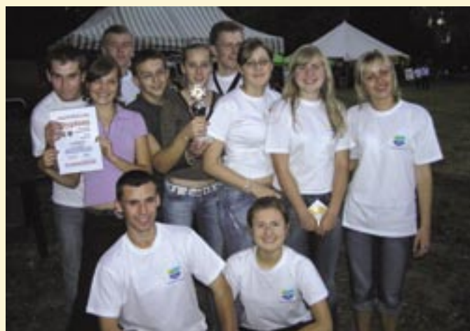
Turniej Gmin 2006.