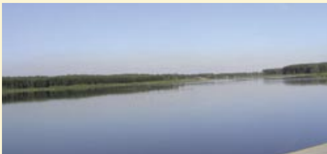
Zbiornik Retencyjny Murowaniec.

Do jednego z najważniejszych zadań inwestycyjnych powstałych na terenie Gminy wpisującego się perspektywnie w rozwój Gminy Koźminek jest ukończenie w roku 2005 budowy Zbiornika Retencyjnego Murowaniec. Z inicjatywy Gminy, Marszałek Województwa w roku bieżącym przystąpił do jego pogłębienia, co w perspektywie ma zdecydowanie poprawić jego walory nie tylko retencji, rekreacyjno-turystyczne i co bardzo ważne oddziaływania na otaczające środowisko. W chwili obecnej łączny koszt inwestycji to - 7 520 000,00 zł.