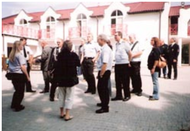
Delegacja Strażaków z Niemiec.

Kolejnym etapem pobytu gości niemieckich była remiza OSP Koźminek. Gospodarze pokazali salę widowiskową wraz z zapleczem, garaże wraz z ich wyposażeniem tzn. samochodami i sprzętem przeciwpożarowym. Na zakończenie wymieniono się drobnymi upominkami i prezentami.