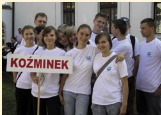
Turniej Gmin w Żelazkowie.