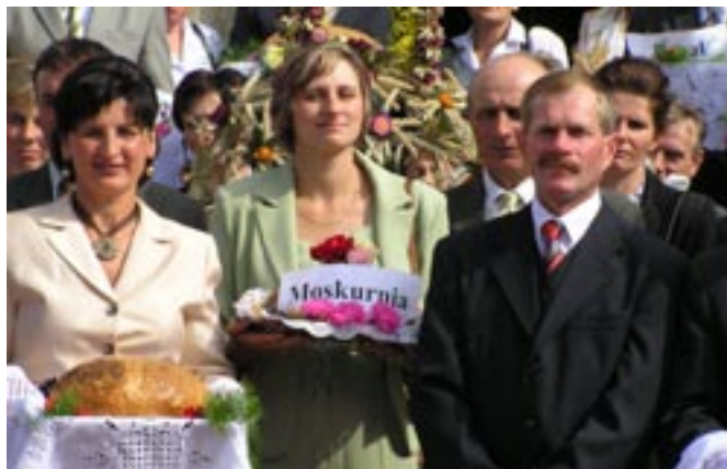
Starostwie Dożynek (Starościna stoi z lewej).