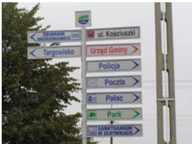
Nowe znaki informacyjne.

Wymiana znaków drogowych w Koźminku (2005) - 27 925,78 zł.