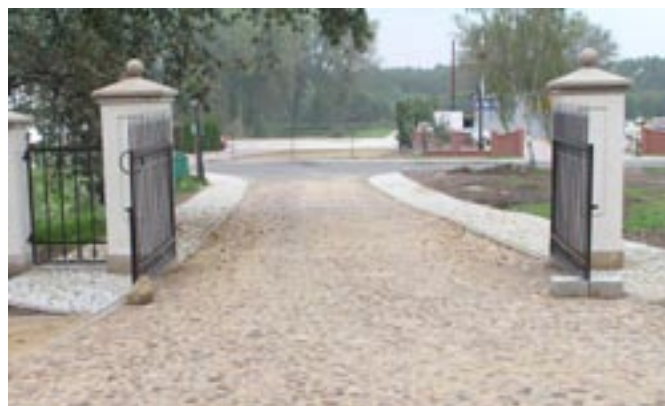
Brama wjazdowa do parku.

Rewitalizacja Zespołu Pałacowo-Parkowego w Koźminku (2005-2006) - 709 069,10 zł z czego dotacja programu Odnowa Wsi oraz Zachowanie i Ochrona Dziedzictwa Kulturowego wyniosła 63,46% co stanowi kwotę - 450 000,00 zł.