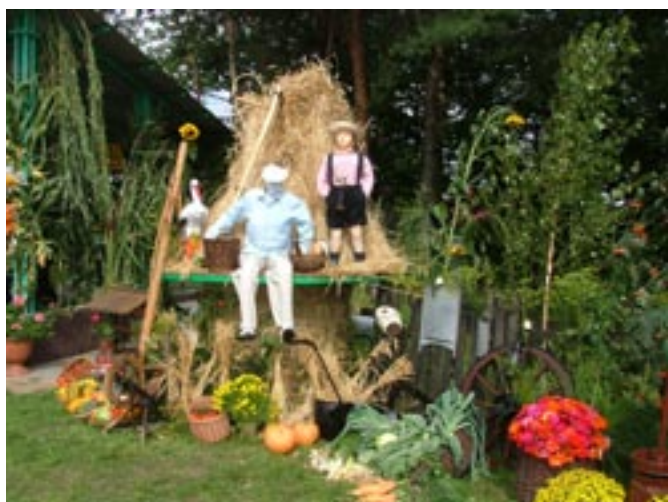
Dekoracja sceny na Dożynkach Gminnych.