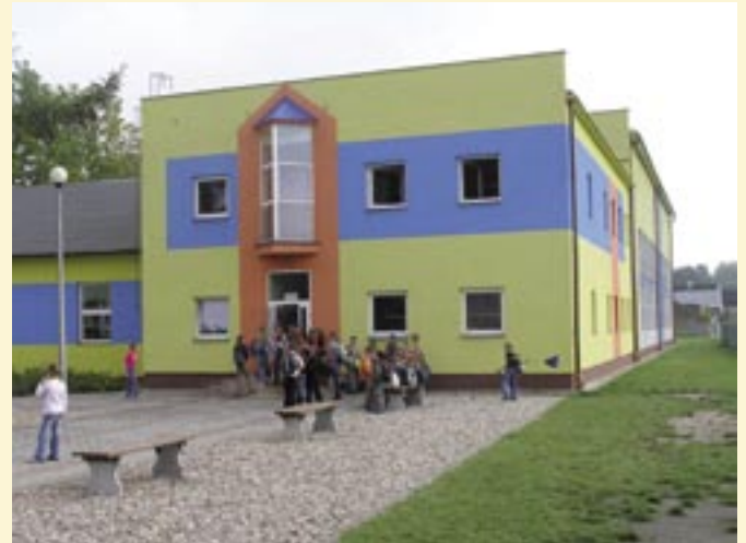
Widok na nową halę sportową w Koźminku.

- 2 571 857,94 zł w tym dotacja celowa otrzymana z MENIS - 900 000,00 zł.