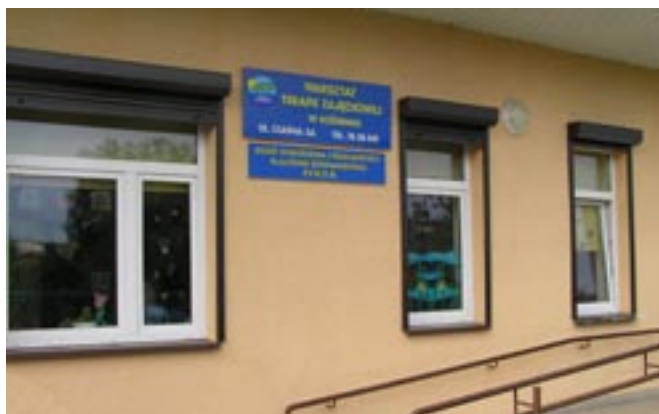
Warsztat Terapii Zajęciowej.

Uruchomienie Warsztatów Terapii Zajęciowej (2003) - 250 000 zł