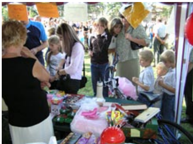
Loteria fantowa.

Na dożynkach nie zabrakło także loterii fantowej zorganizowanej przez Stowarzyszenie Działające na Rzecz Społeczności Lokalnej „Tu i teraz”.