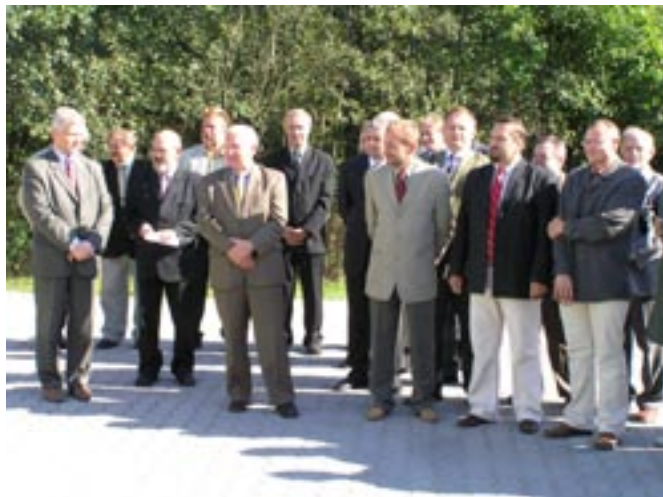
Goście zaproszeni na uroczystość oddania zmodernizowanej oczyszczalni.

ków zwiększono jej przepustowość z 500 m 3 do 700 m 3 na dobę, co pozwoli na dalszą rozbudowę sieci kanalizacyjnej na terenie gminy.