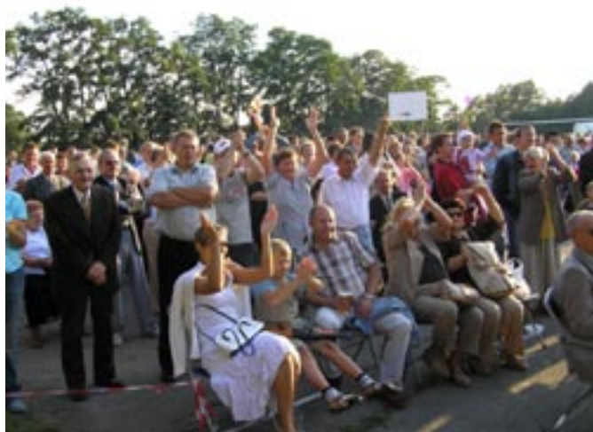
Tłumy na występie Wesołego Triu.

Imprezę dożynkową prowadził znany konferansjer Dariusz Dymalski. Uwieńczeniem wieczoru była zabawa taneczna z grupą „Retro”.